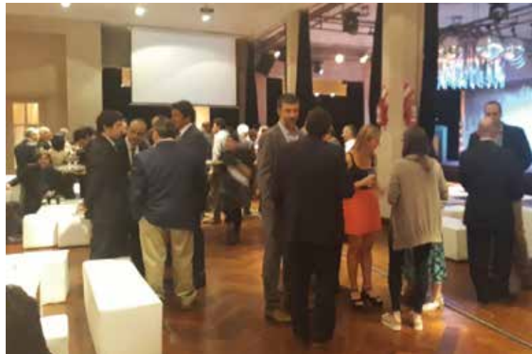
El Cóctel de la Energía Eléctrica contó con la presencia de más de 250 profesionales del sector.