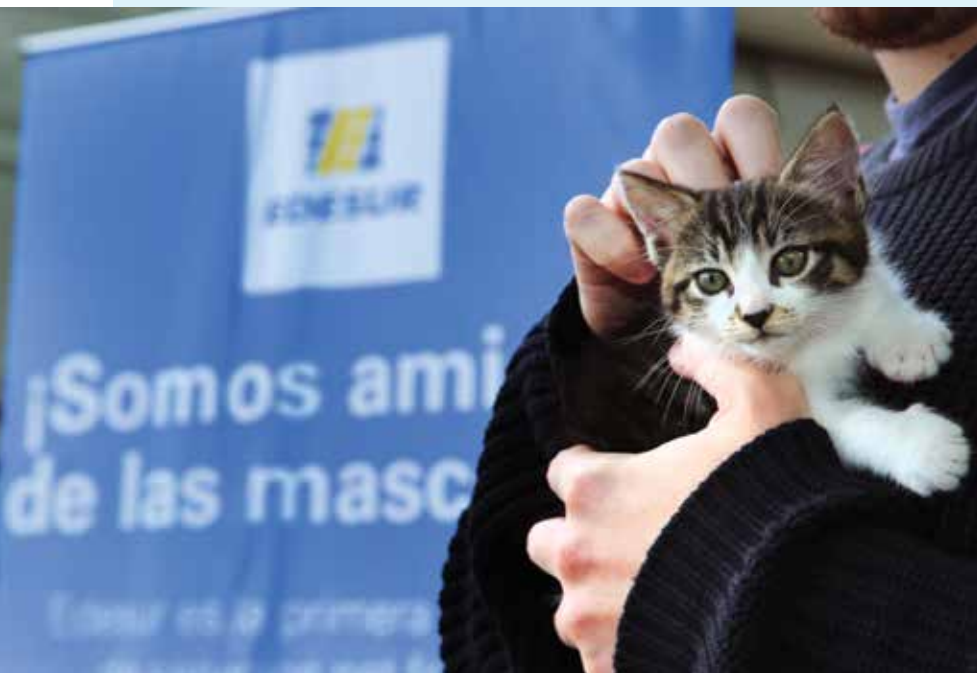
Edesur permitió el ingreso con mascotas en una de sus oficinas comerciales.

El edificio de Edesur de Villa Lugano es un gran centro de operaciones de mantenimiento y obras donde habitualmente se encuentran mascotas abandonadas. Como asociaciones proteccionistas trabajan en esta zona, la distribuidora promueve un servicio abierto a la comunidad que fomenta el cuidado responsable y convivencia armoniosa con los animales. ■