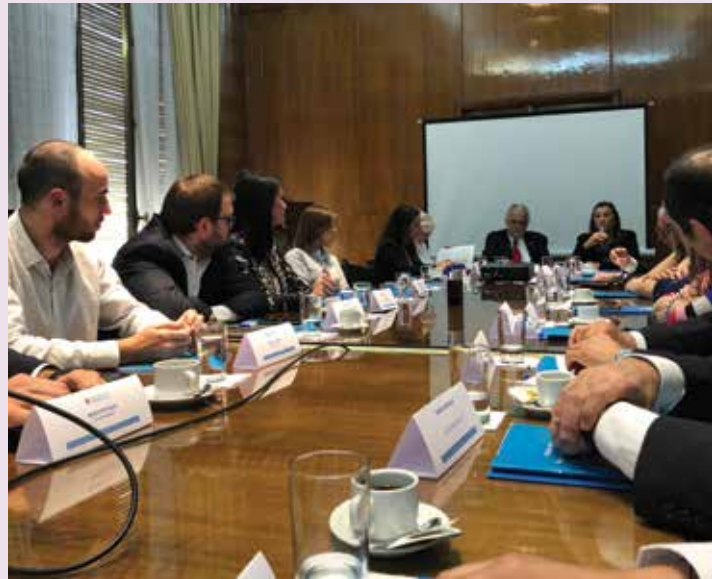
Representantes de 23 instituciones participaron del proceso de diálogo

Funcionarios, académicos y empresarios debatieron los objetivos y metas para lograr una definición final sobre la matriz energética al 2050, la forma de producirla y consumirla, con base en lo trabajado en las jornadas previas.