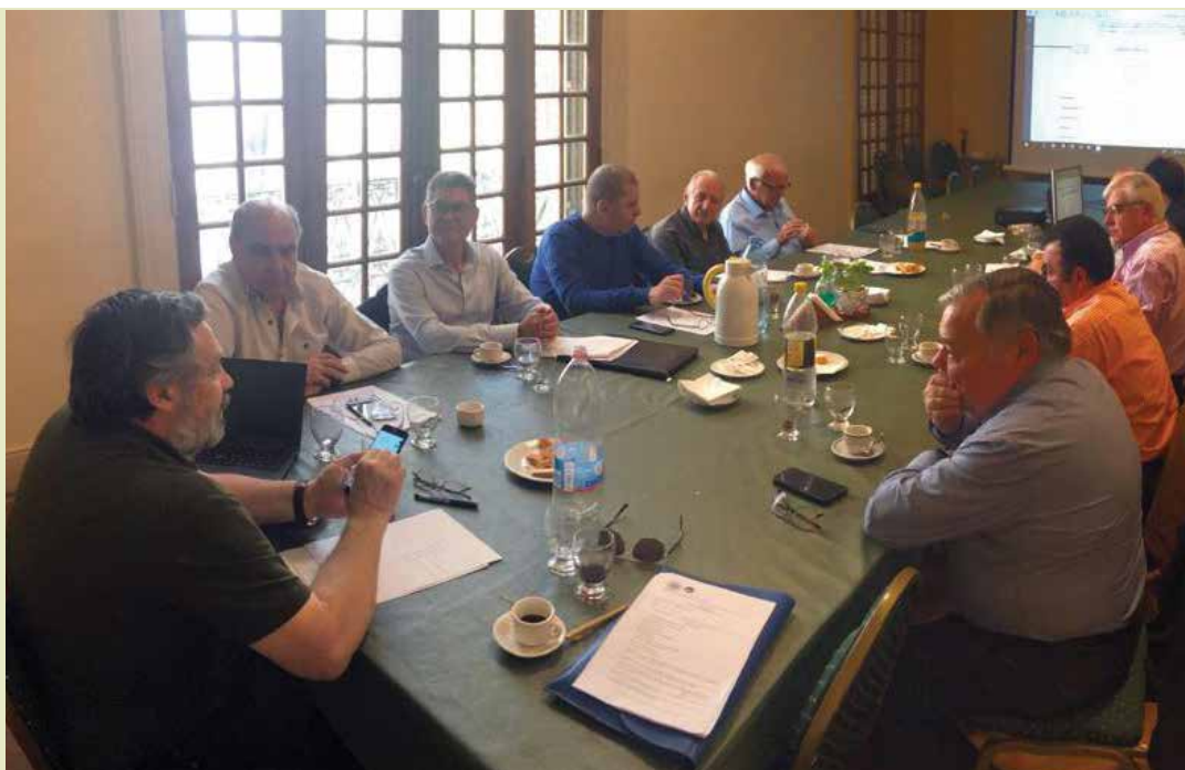
Comisión Directiva de la Asociación Electrotécnica Argentina.