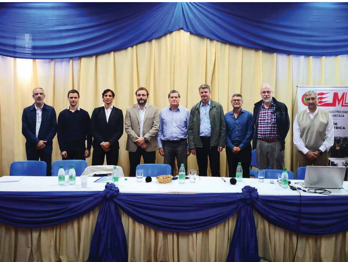
Especialistas del sector durante la jornada realizada en la provincia de Misiones.

Bulacio afirmó que el objetivo del encuentro fue mostrar las presentaciones más destacadas que formaron parte de Cidel Argentina 2018, entre los que resaltan las referidas a la generación distribuida y la movilidad eléctrica.