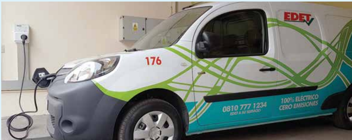
La primera camioneta 100% eléctrica en la flota de vehículos de EDET.

En su compromiso medioambiental, la distribuidora integra a su flota de trabajo, la primera camioneta eléctrica.