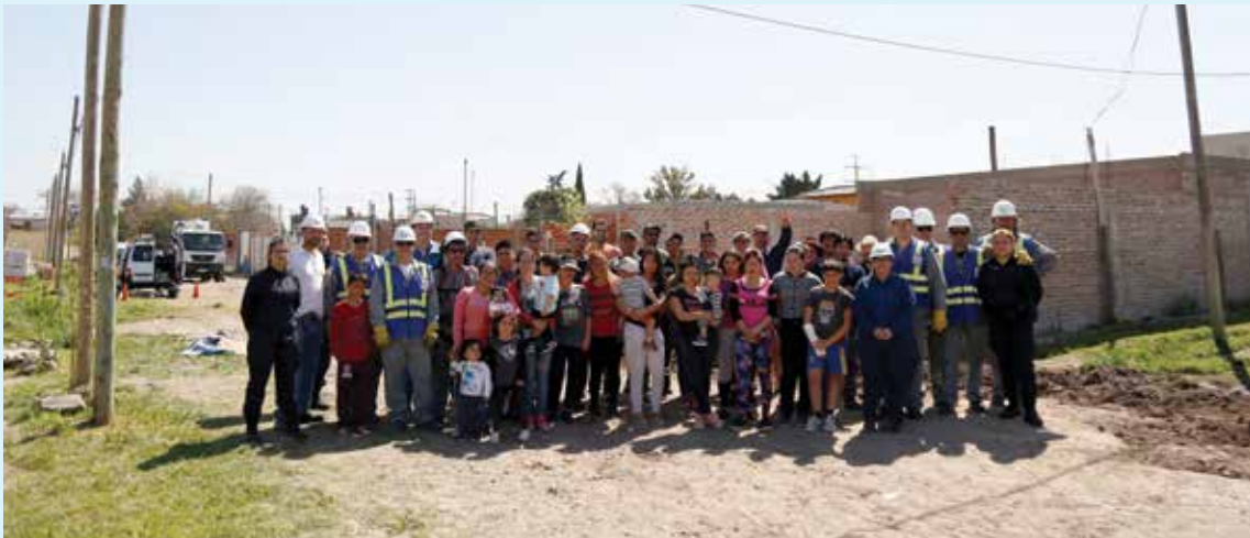
Vecinos de Florencio Varela y especialistas de Edesur se organizaron para quitar una red clandestina de electricidad.

Edesur regularizó a un grupo de 50 familias del Barrio KM 26. Los vecinos se organizaron y pidieron ayuda a la empresa para quitar una red clandestina de electricidad tendida en sus calles y conseguir medidores propios.