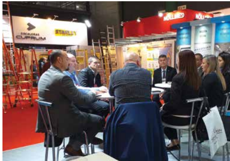
La Comisión Técnica de Compras en la Biel Light Building.

La Comisión Técnica de Compras de Adeera estuvo presente en diferentes reuniones en el primer día de la Biel Light Building.