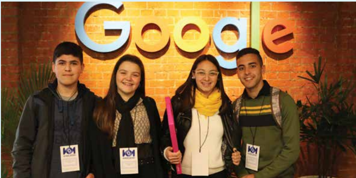
Estudiantes becados por Edesal en las oficinas de Google Latinoamérica en el marco del programa Visión 2030.

Es un programa que se realiza en Buenos Aires y que busca apoyar los procesos de desarrollo de capacidades de los jóvenes.