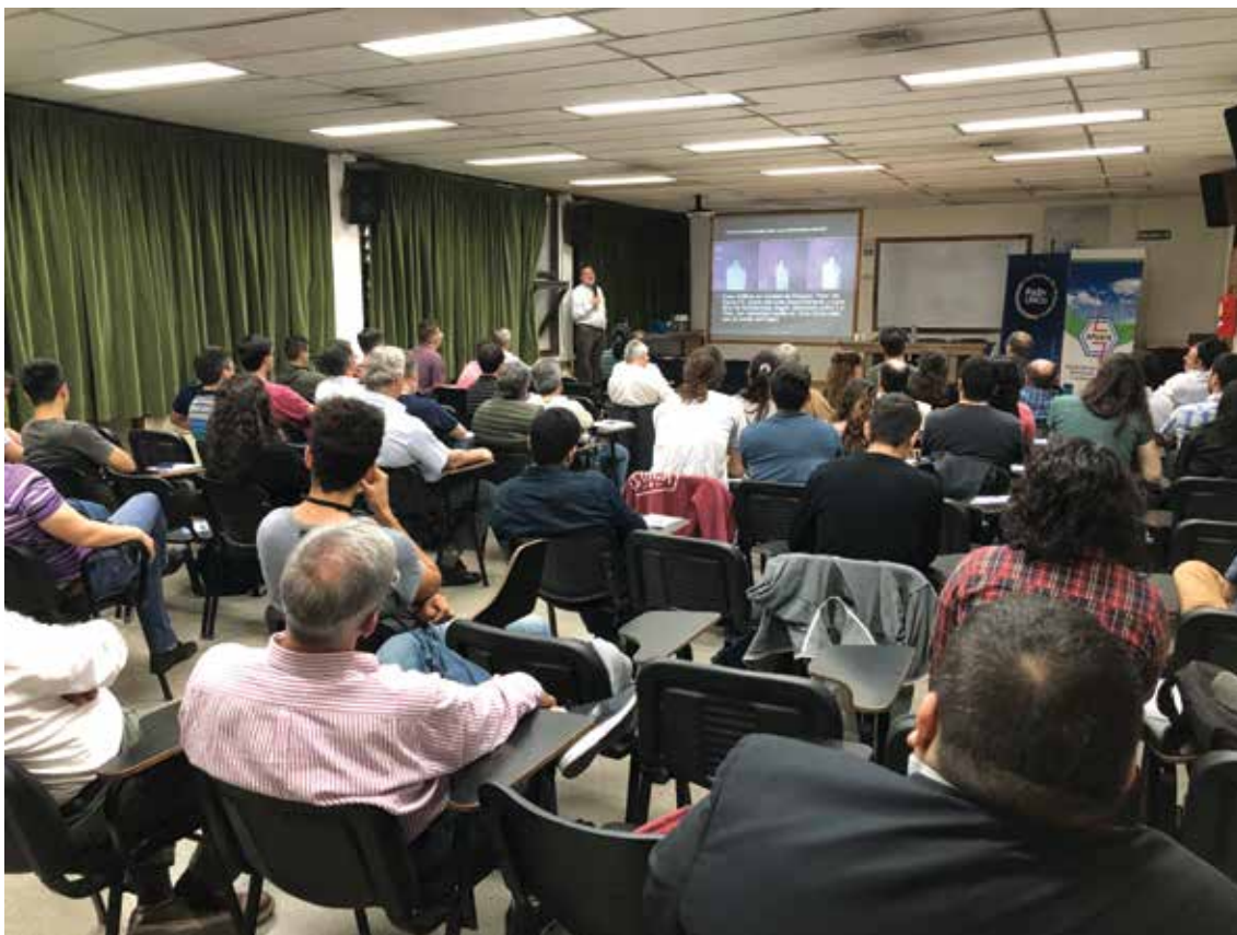
Participantes de la jornada de extensión del Cidel en la Facultad de Ingeniería de la Universidad Nacional del Comahue, Neuquén.