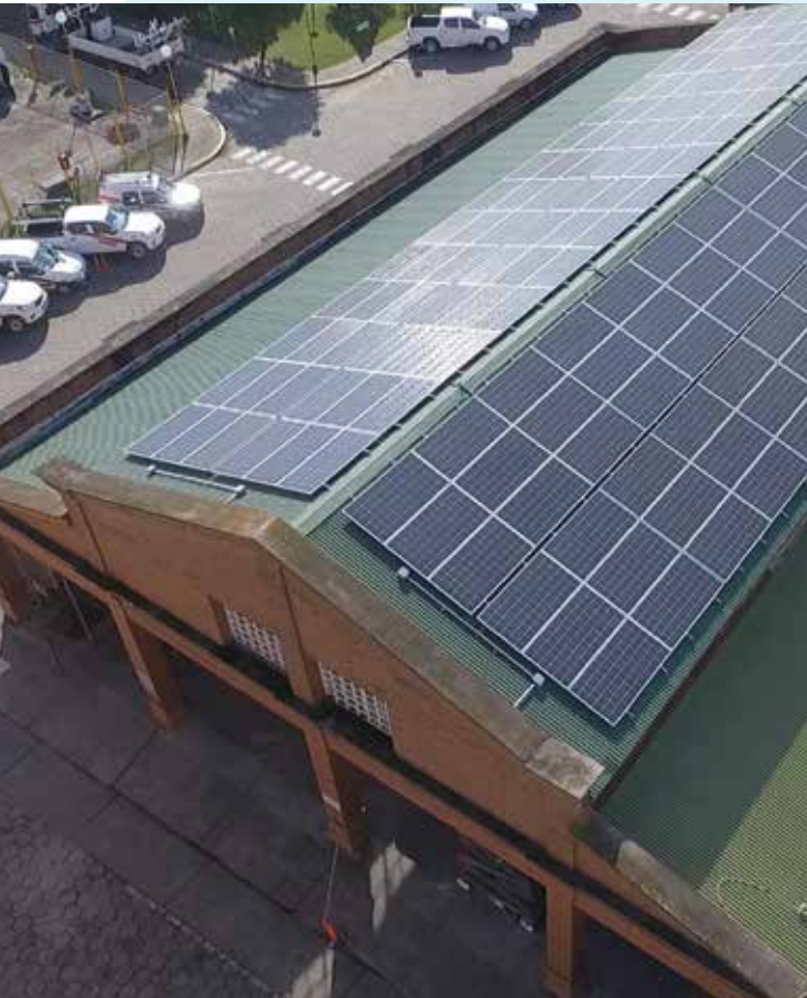
Paneles Solares instalados en Administración Metropolitana de Edet.

Estas iniciativas permiten observar el rumbo que sigue la empresa, que se orienta hacia el nuevo rol que posiblemente adquiera en un futuro cercano: de distribuidora a administradora de energía y plataforma de servicios, con la red de distribución como elemento integrador. ■