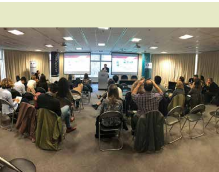
Destacados profesionales en las instalaciones de Beccar Varela.

Este grupo de trabajo fue lanzado en abril de 2015 y Adeera lo conforma desde su inicio. Surgió como un espacio para asistir a las empresas firmantes a abordar los principios ambientales, sus temáticas y herramientas relacionadas. ■