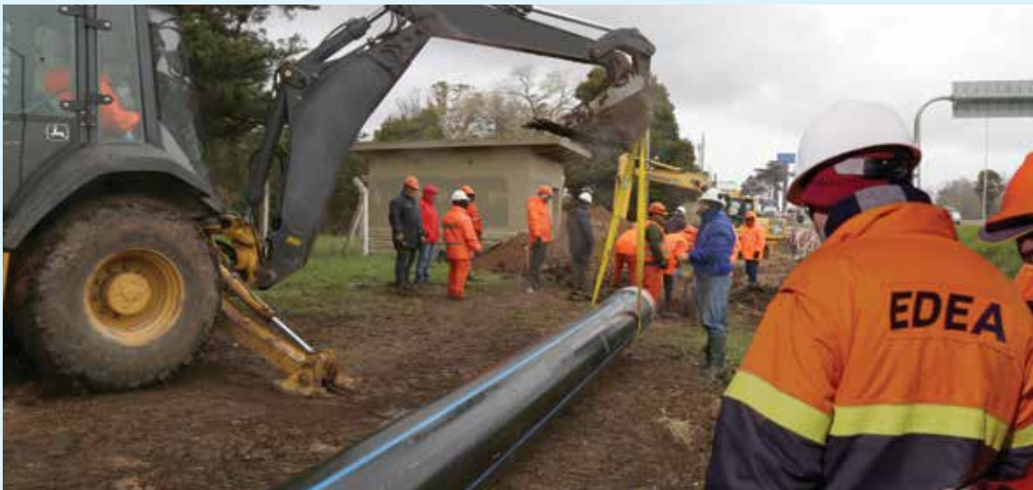
Construcción de una línea doble terna en alta tensión 132 kV.

Se instaló un equipamiento que posibilita mejorar su capacidad y versatilidad. Permite un mejor aprovechamiento de los espacios existentes y la reacondicionan para su posterior conexión con la doble vinculación en alta tensión con Santa Clara del Mar. También posibilitará contar con un campo de reserva para una futura conexión con la ET en Vivoratá, a donde llegará la línea de 500 kV proveniente de Bahía Blanca. ■