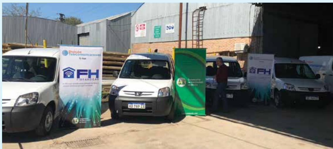
Cooperativa en la presentación de los nuevos móviles adquiridos para prestar el servicio de FH.

Finalmente, la conexión con Arsat permite mantener los costos bajos para ofrecer un servicio de máxima calidad y con precios accesibles. ■