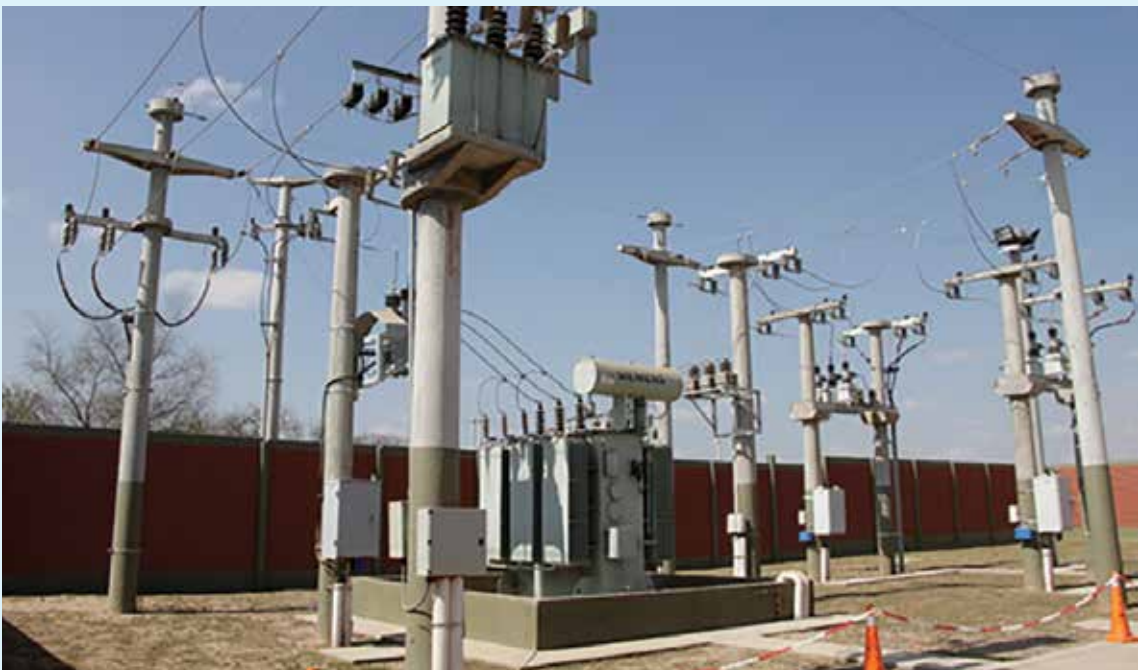
Estación de Rebaje El Castoral 33/13,2 kV.

Las obras detalladas que implican una inversión de más de 30 millones de pesos, otorgarán mayor confiabilidad al sistema de distribución de media tensión, mejorarán la calidad de servicio brindada en la localidad de Villa de Leales, beneficiarán aproximadamente a 2.000 usuarios y permitirán cubrir la demanda actual, el crecimiento y la instalación de futuros emprendimientos agroindustriales. ■