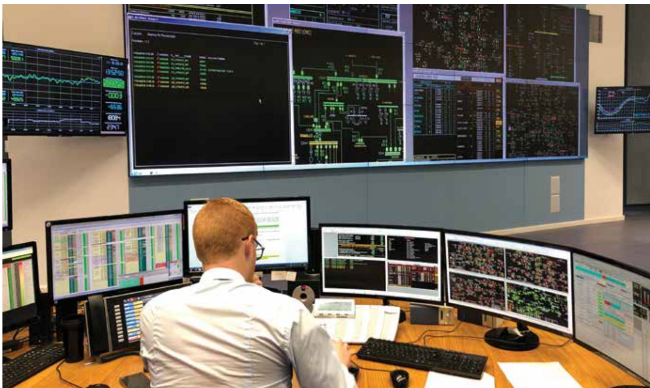
Centro de control de operaciones de Cammesa en la ciudad de Pérez, Santa Fe.