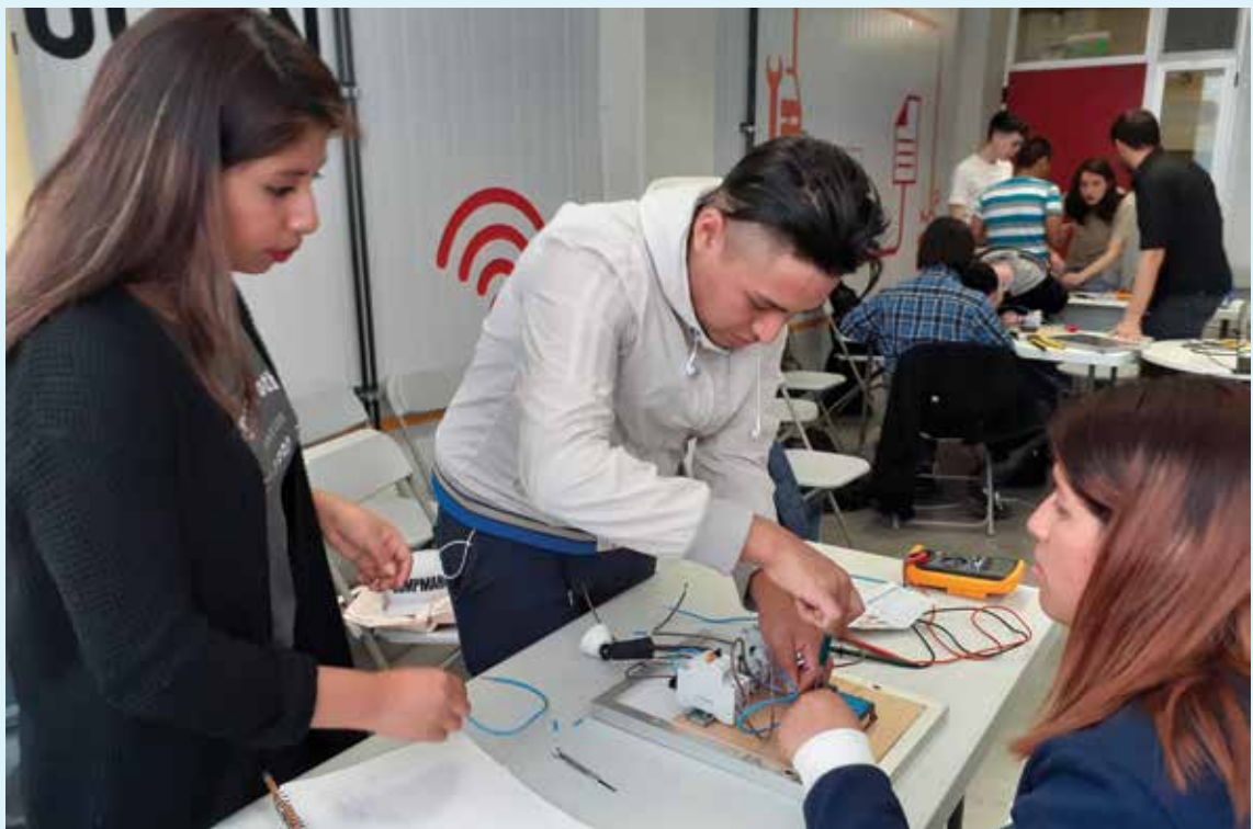
Alumnos de escuelas técnicas de CABA en uno de los talleres ofrecidos por la empresa.

Es importante destacar que este año la empresa alcanzó a capacitar a más de 150 alumnos a quienes al final de la jornada se les entregó un certificado de participación. ■