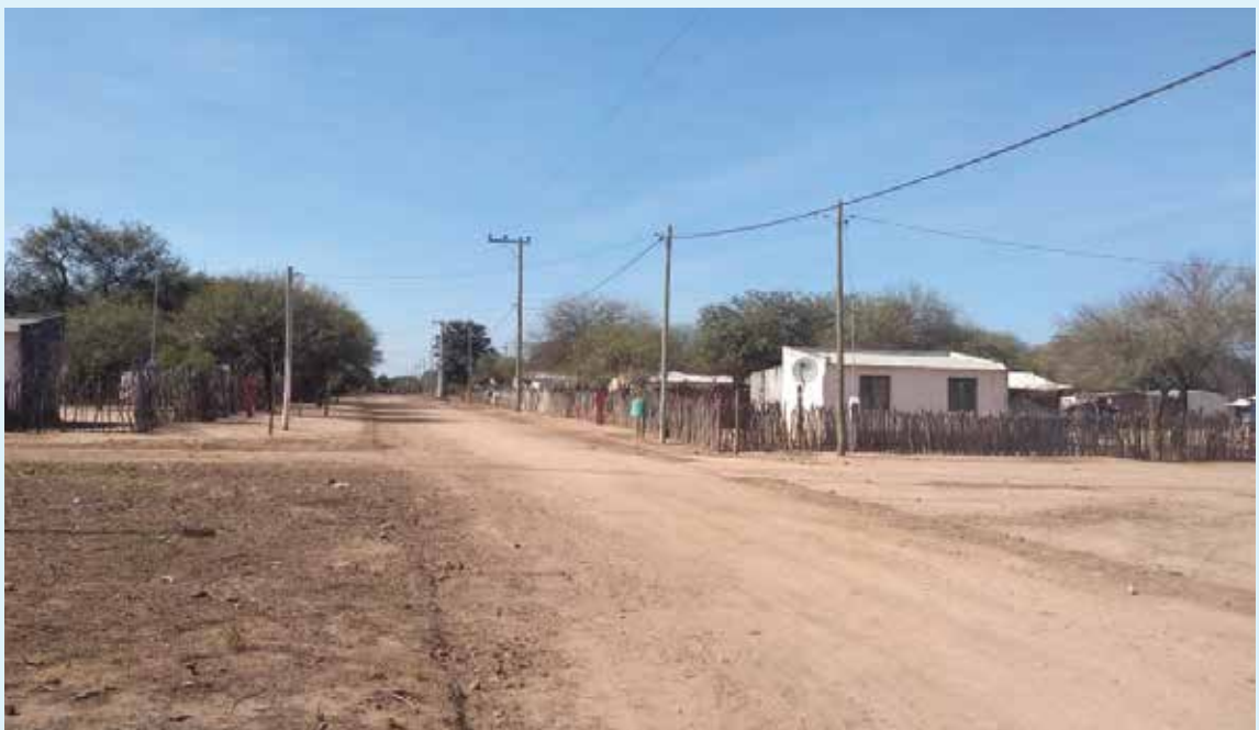
La distribuidora realiza obras para la conexión al Sadi de comunidades indígenas aisladas.

Es importante remarcar que a la fecha, más del 98,4% de la población salteña se encuentra con servicio de energía eléctrica. ■