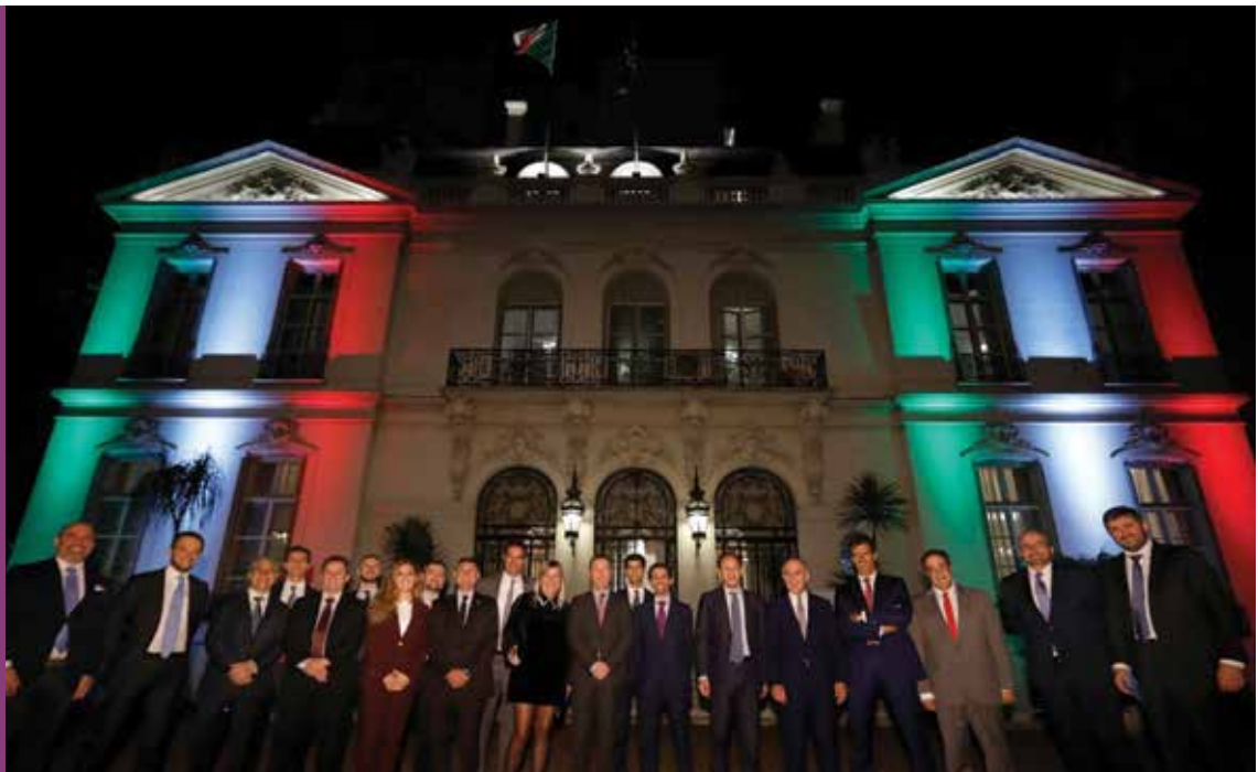
Destacados profesionales en el encuentro realizado en la Embajada de Italia.