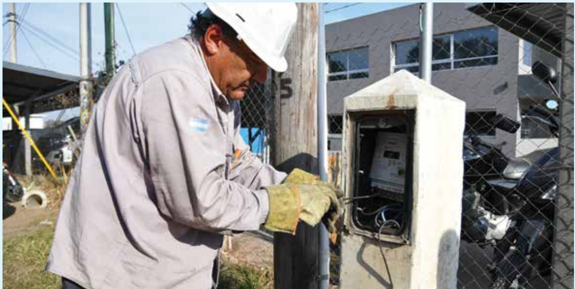
Operario de Epec en la conexión de los primeros medidores bidireccionales a empresas.

Se trata de industrias que podrán generar electricidad a través de fuentes renovables.