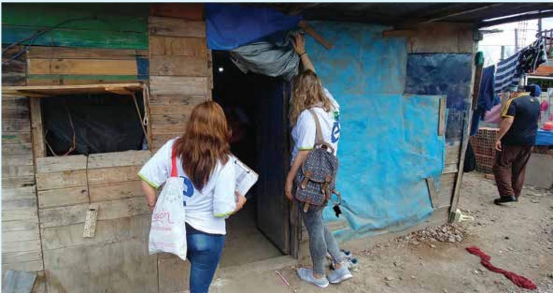
Equipos de la fundación ProVivienda Social visitan a vecinos del barrio “La Lata”

En una primera etapa de esta iniciativa ya se instalaron unos 300 MIDE a otras tantas familias que accedieron al servicio eléctrico en condiciones de seguridad. La siguiente etapa incluye un recorrido y visita a las familias que instalaron su MIDE, para intercambiar las experiencias de uso. ■