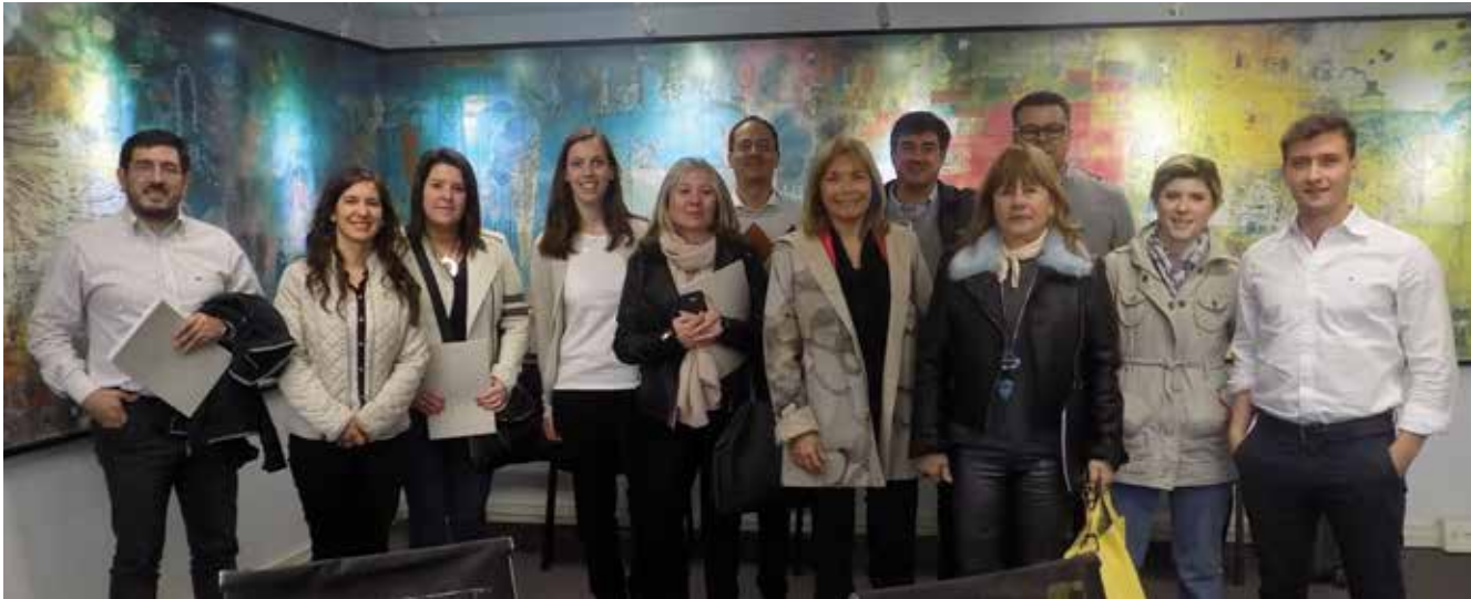
Integrantes de la Comisión Técnica de Impuestos en las instalaciones de Adeera.

Participaron del encuentro representantes de las distribuidoras Edenor, Epe, Epec, Edelap, Edemsa, Edet, Edesal, Enersa y Refsa, quienes abordaron diferentes temas de interés para el sector.