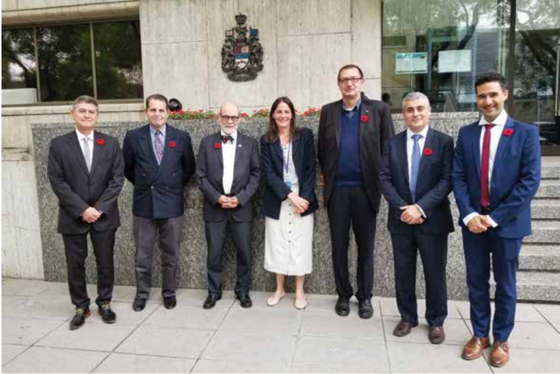
El embajador de Canadá en Argentina (tercero) junto a delegados comerciales de la institución y especialistas de Adeera.

y realizó una actualización sobre la transición energética y los desafíos hacia el futuro.