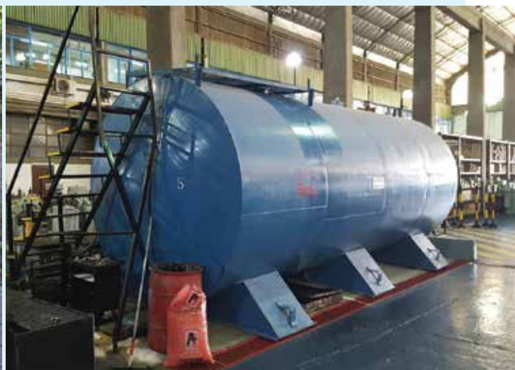
Cisterna móvil para recolectar aceite usado. Cisterna para aceite a regenerar.