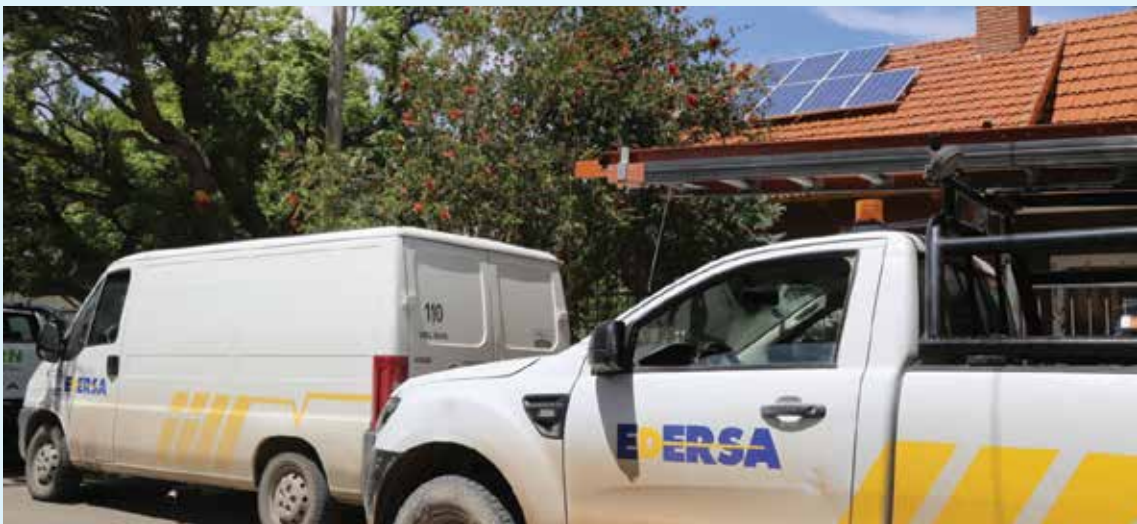
Edersa ya conectó a sus redes a ocho Usuarios Generadores (Uger).

Ya existen Usuarios Generadores que inyectan energía a la red en las ciudades de Cipolletti, General Roca, Cinco Saltos, Allen y la cordillerana El Bolsón. “Es importante destacar para que todo esto funcione, es paso ineludible tener una red confiable, calidad de servicio y asistencia operativa constante para los Uger”, agregó el directivo. Barhen adelantó el próximo proyecto que encarará Edersa: “Actualmente analizamos la solicitud de un Gran Usuario, que en zona de campos pretende hacer uso de la energía fotovoltaica para abastecer bombas de riego para la producción de granos y forrajes. La potencia de generación alcanzará los 70 kW y la inyección será en media tensión” . ■