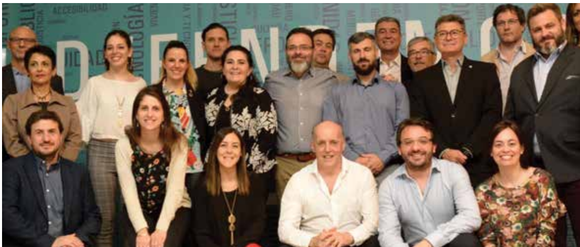
Representantes de la Mesa Directiva de la Red Argentina del Pacto Global.

La Mesa Directiva llevó a cabo dos encuentros, uno en la Torre de Ypf en Puerto Madero y otro en el auditorio de la Defensoría del Pueblo de CABA.